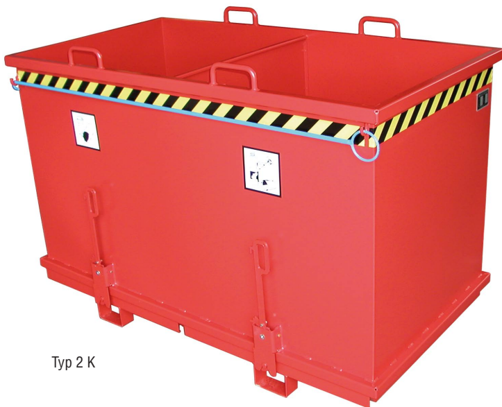
Typ 2 K