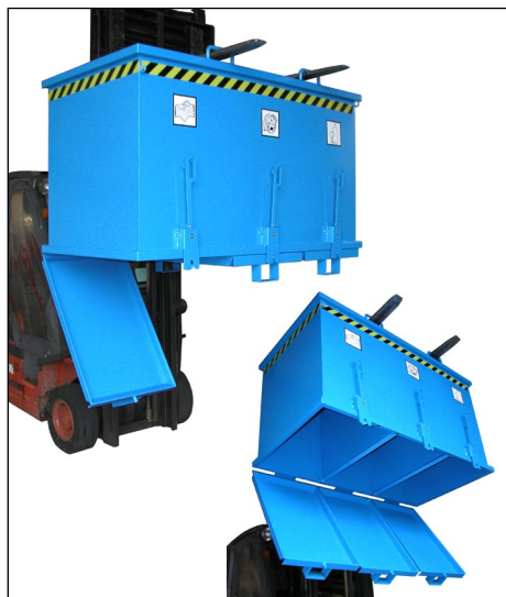
Typ 3 K mit 3 Bodenklappen