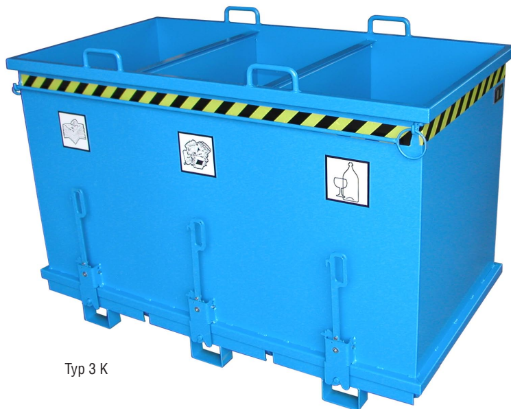
Typ 3 K