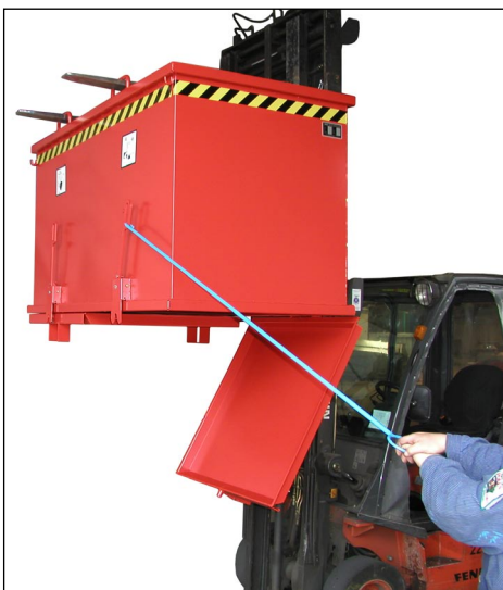
Typ 2 K mit 2 Bodenklappen