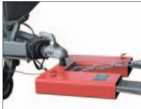
problemloses Anhängen vom Staplersitz aus