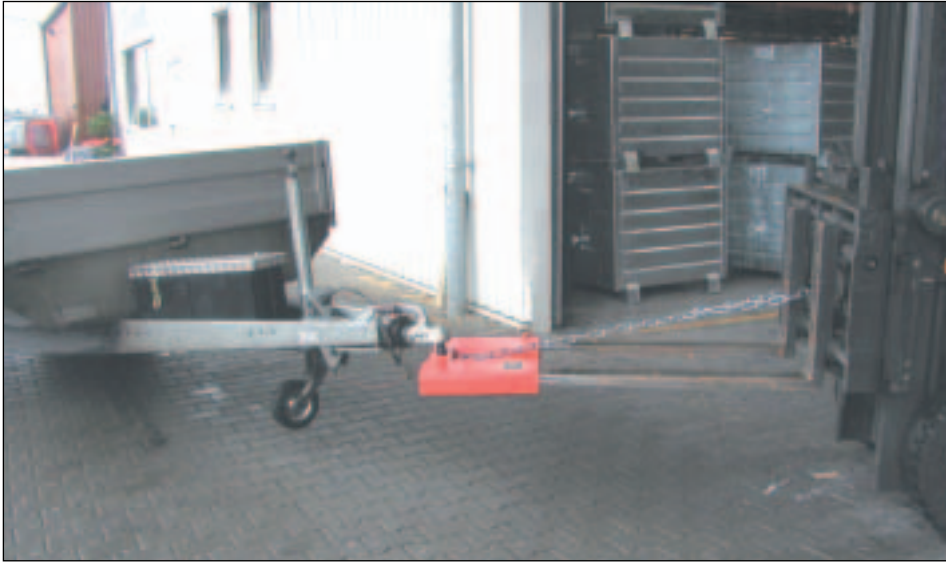
Typ RH mit Gabelstapler und Anhänger