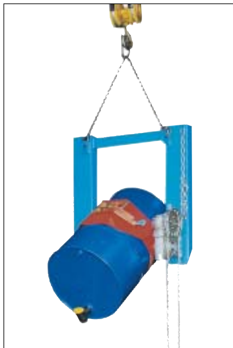
Typ FLEX-K mit Endloskette bei Kraneinsatz