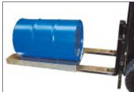
Aufnahme durch Gabelstapler