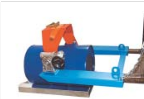
Ablage auf Regal-Fasspalette Typ RP