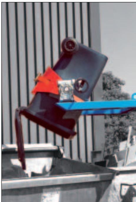
Typ FLEX-HK, Entleerung 240 l Müllbehälter